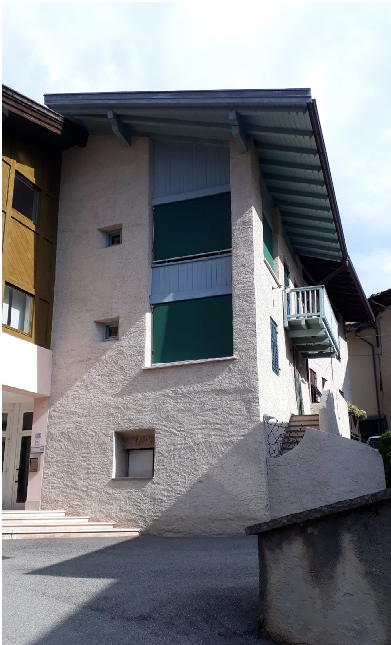
Vista da ovest